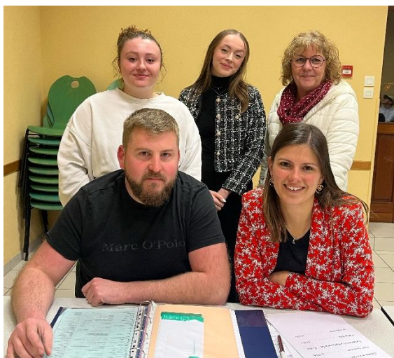
Nouveau bureau des Festous

Ainsi que 22 bénévoles motivés pour cette année ! Nous vous remercions pour la soirée année 2000 du 2 mars et nous vous attendons nombreux le 13 juillet pour la traditionnelle « soirée moules frites ». A très vite. Les Festous.